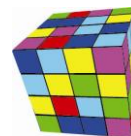
Tabela przestawna: poprawienie błędu I/O 32

Błąd pojawiał się podczas próby utworzenia kolejnej wersji raportu, podczas gdy poprzednia wersja była w tym samym czasie edytowana w programie Word (który nie pozwalał na modyfikację pliku). Obecnie, zamiast komunikatu o błędzie, pojawia się informacja, że należy zamknąć program Word lub zapisać raport pod inną nazwą.